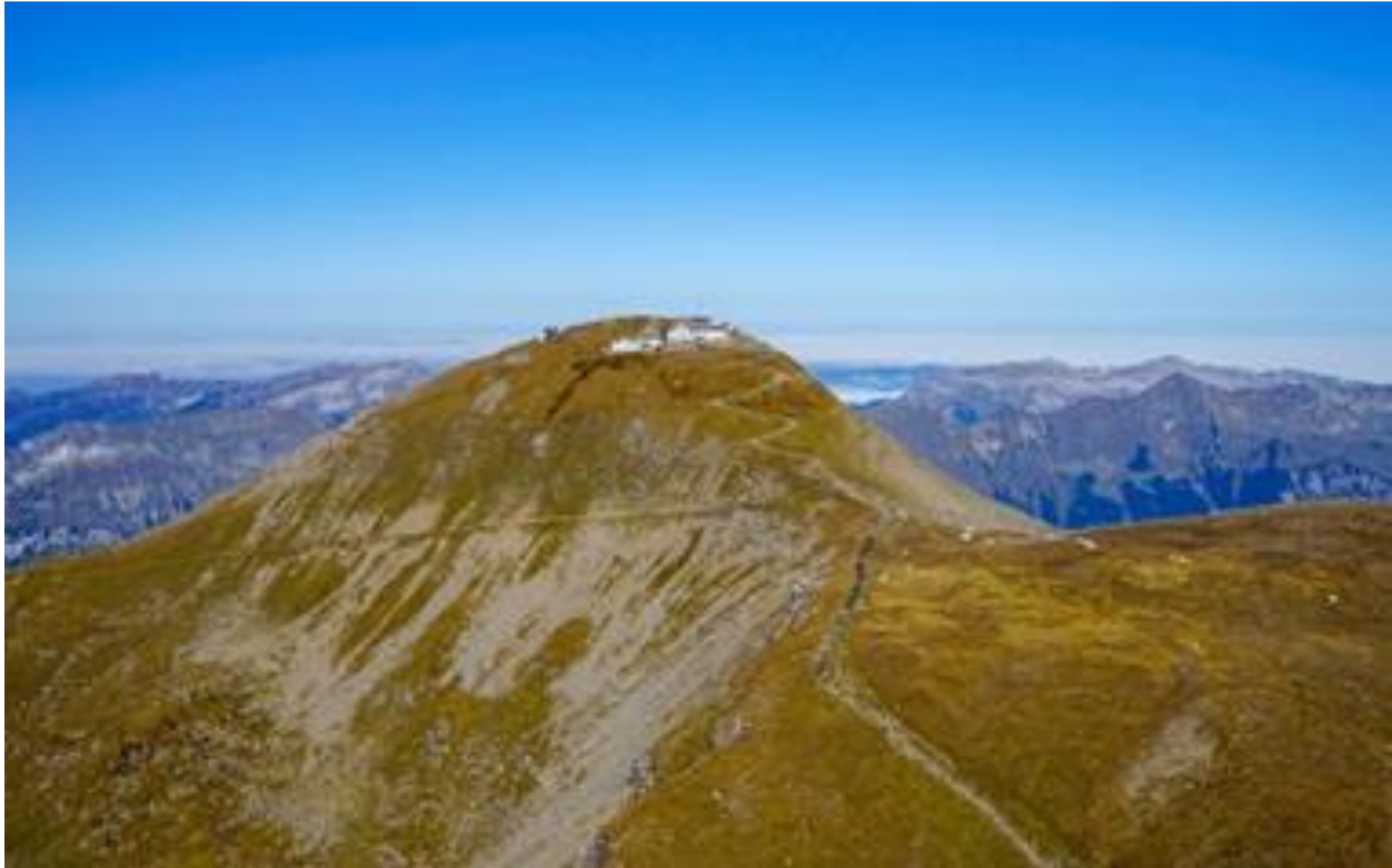
Le Säntis 2502 m.