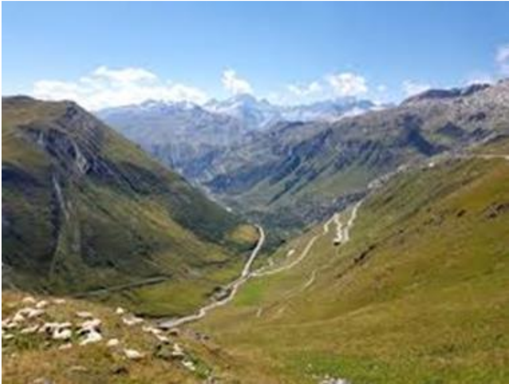
Grimsel 2164 m