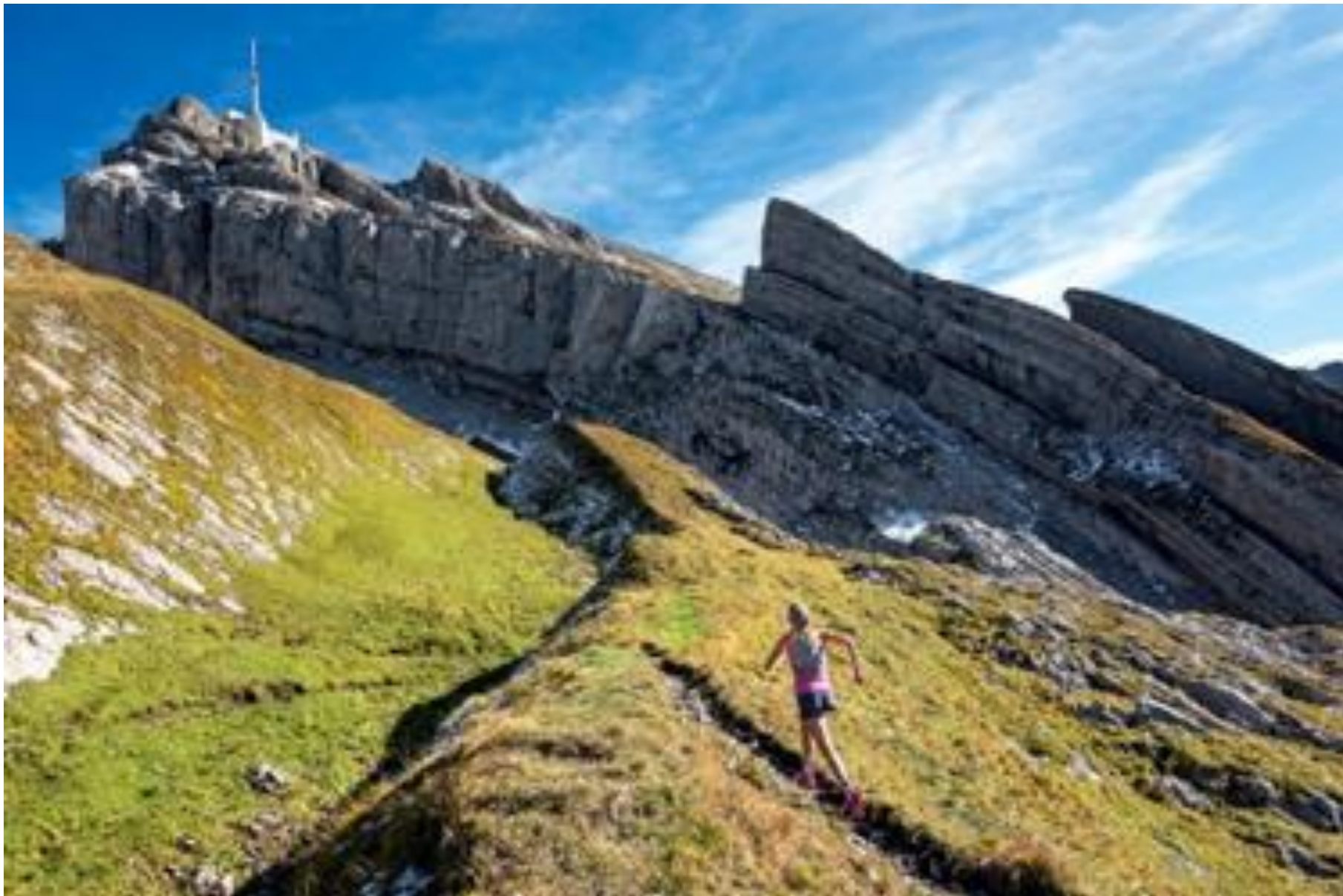
Le Faulhorn, 2681 m