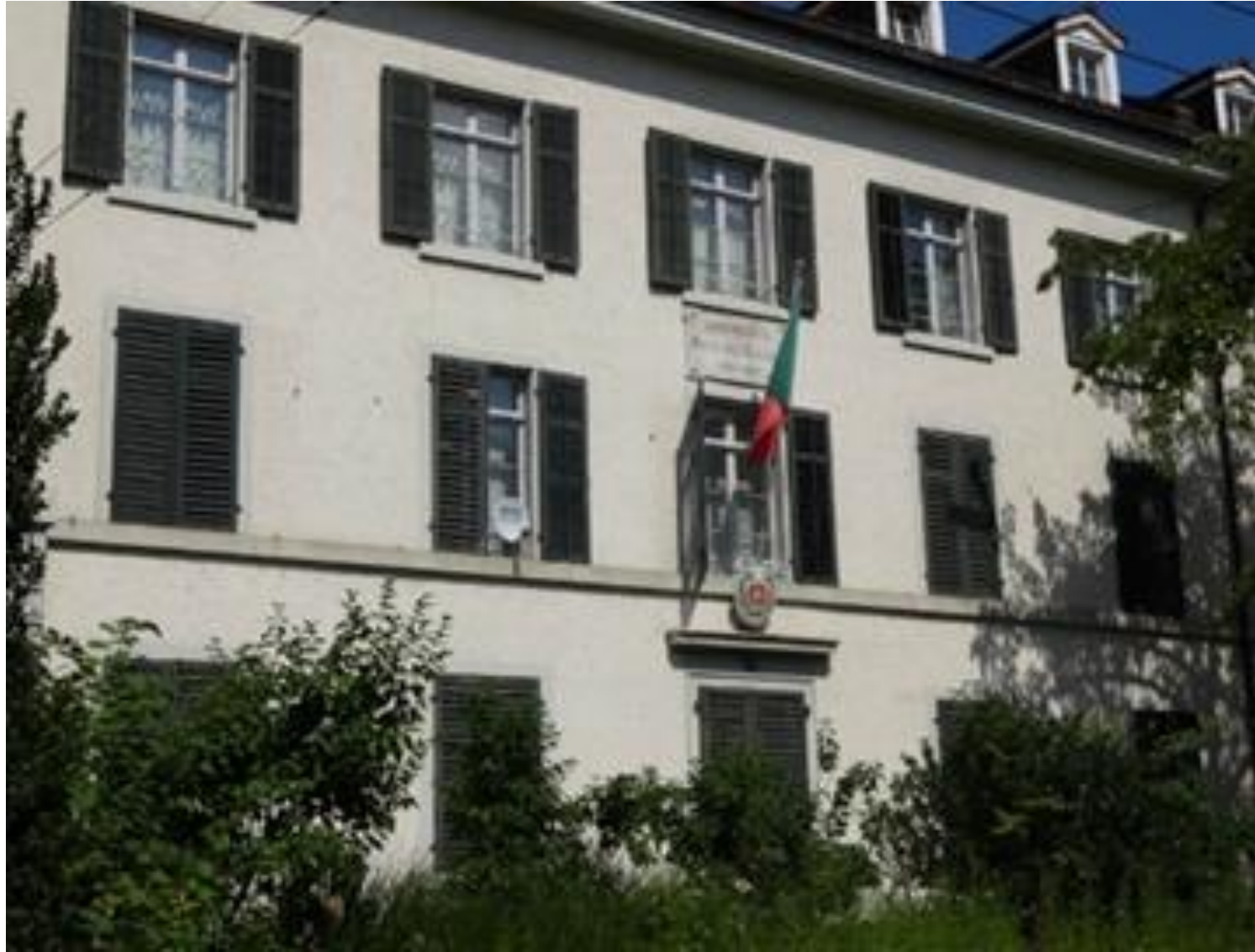
Zurich La Maison Escher