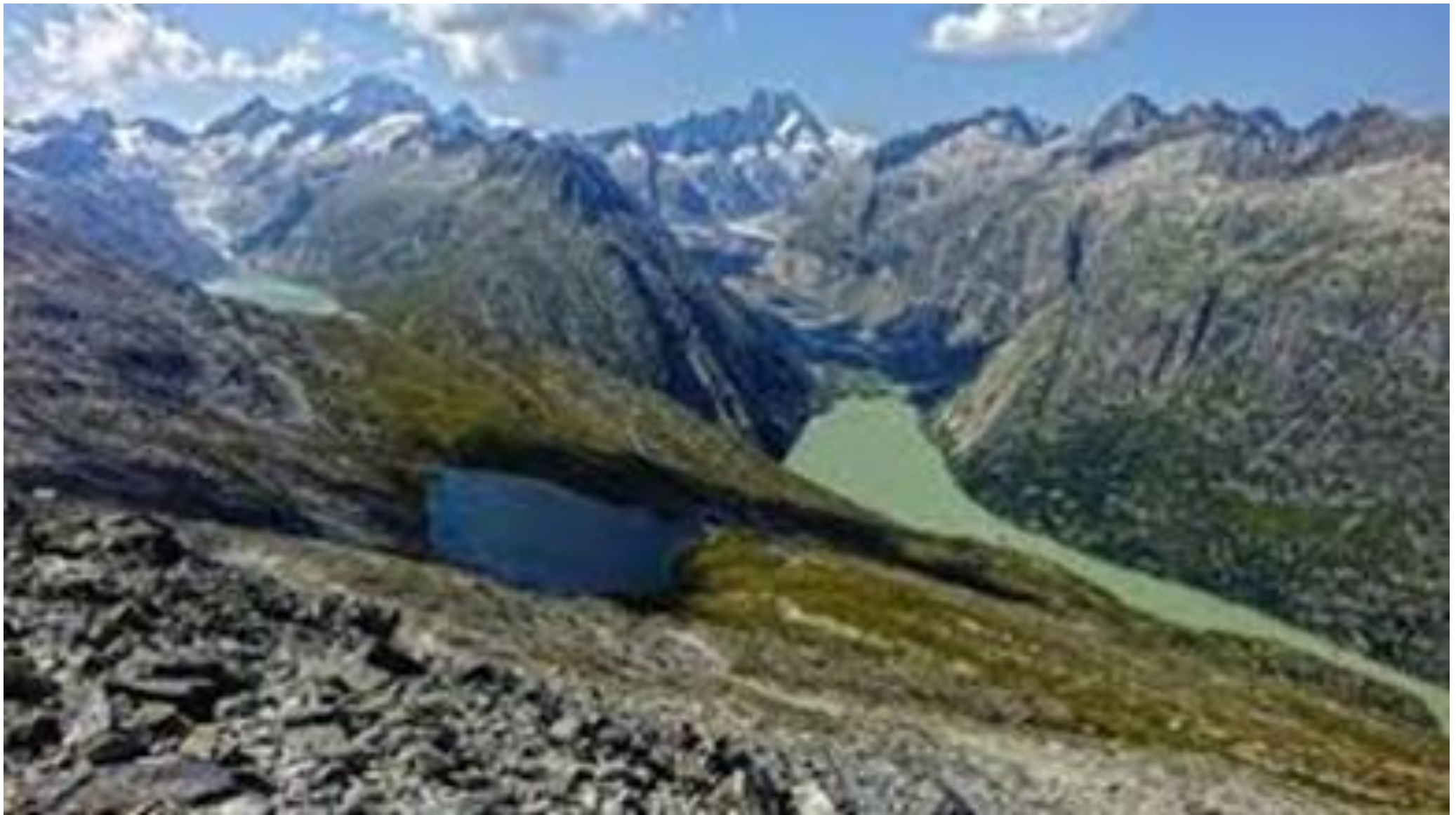
Siedelhorn 2764 m.