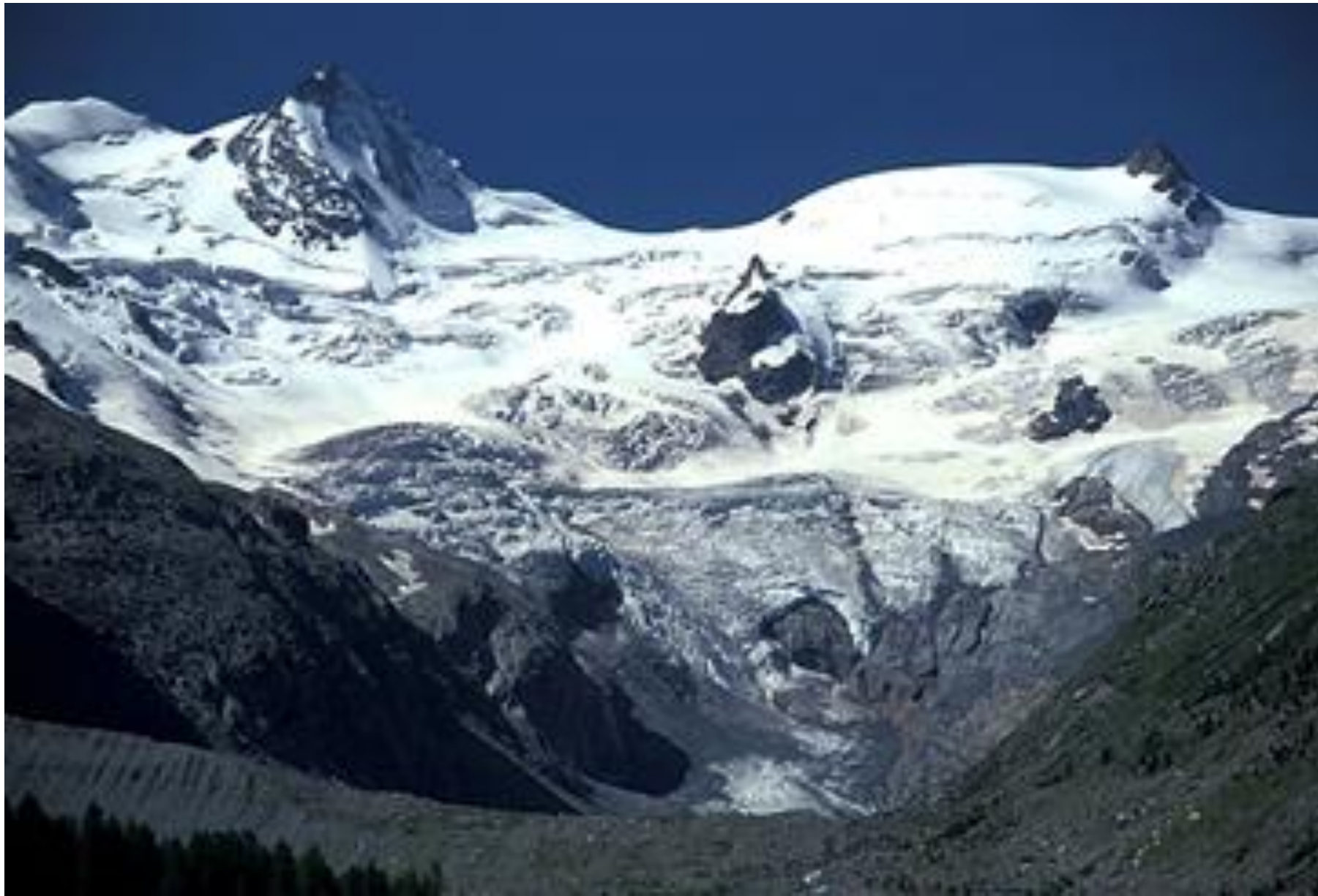
Glacier du Rosetsch ( en 1850, 7km et en 2013, seulement 2.5km )